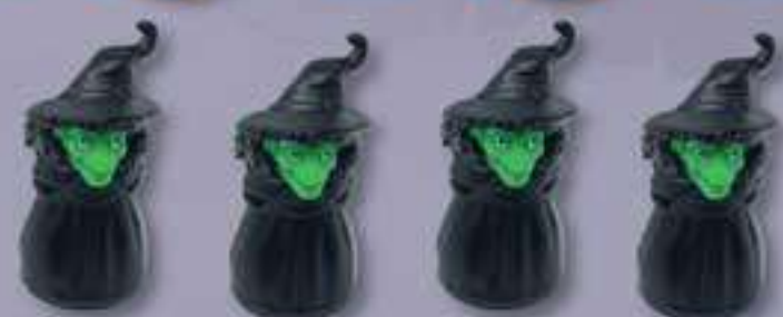
4 Figurines Sorcière