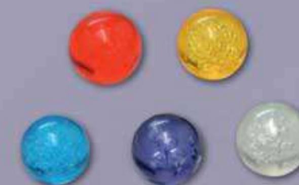
5 Feux follets (billes) : rouge, jaune, violet, bleu et blanc