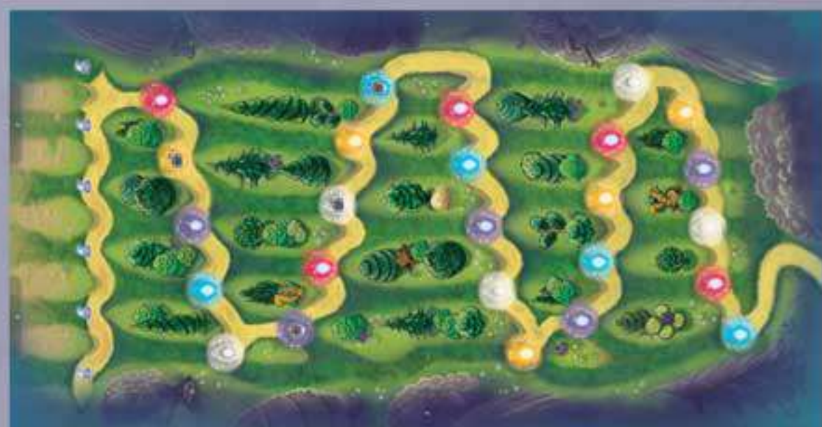
1 Plateau de jeu avec 4 supports (n°1, 2 et 3)