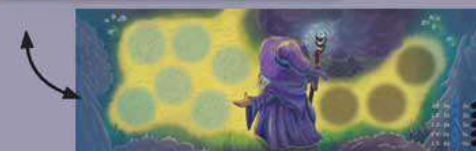
1 Plateau Arrivée Élias recto-verso