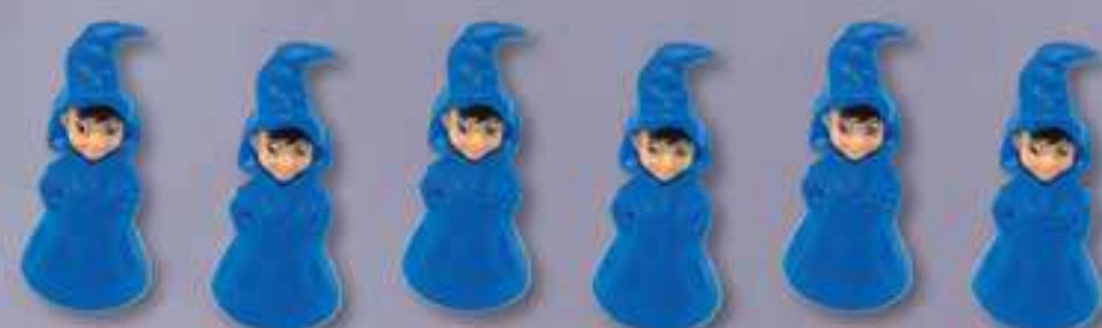
6 Figurines Apprenti