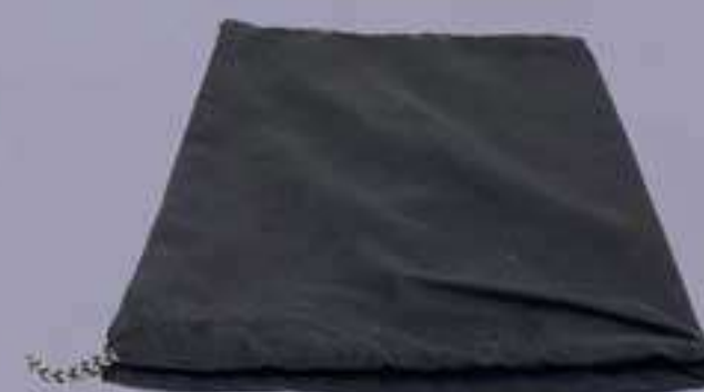
1 sac en tissu